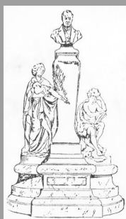
MAISON AUGUSTE COMTE